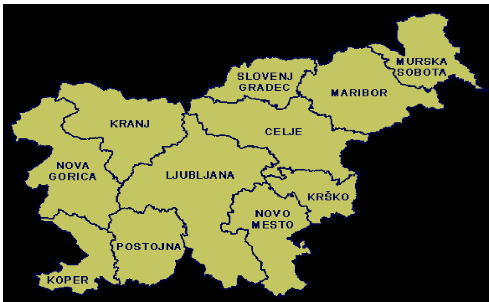
Slika 2: GEOGRAFSKA RAZDELITEV POLICIJSKIH UPRAV

Območje Republike Slovenije je regionalno razdeljeno na Policijsko upravo Celje, Policijsko upravo Koper, Policijsko upravo Kranj, Policijsko upravo Krško, Policijsko upravo Ljubljana, Policijsko upravo Maribor, Policijsko upravo Murska Sobota, Policijsko upravo Nova Gorica, Policijsko upravo Novo mesto, Policijsko upravo Postojna in Policijsko upravo Slovenj Gradec.