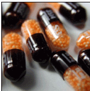
Slika 9: Amfetamin