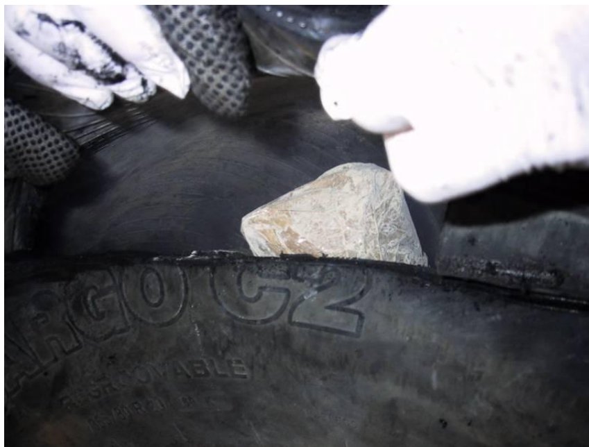
Slika 15: Droga, skrita v rezervnem kolesu