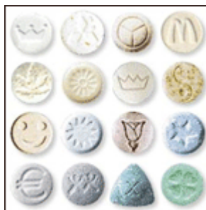
Slika 10: Ecstasy