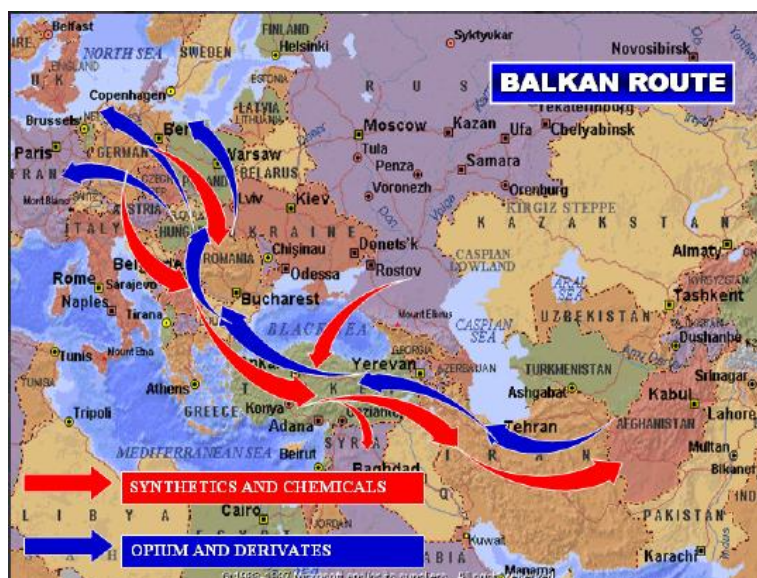
Slika 14: Balkanska pot tihotapstva opija

Tihotapstvo drog v večini poteka po znani »balkanski poti«, kjer drogo tihotapijo iz Afganistana preko Turčije, Bolgarije in nekdanje Jugoslavije v Zahodno Evropo. Različni podatki kažejo, da je čezmejni kriminal v porasti, saj v Afganistanu iz leta v leto pridelajo več opija (Priročnik za vodnike službenih psov policije, 2007, stran 186).