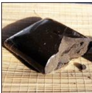
Slika 8: Hašiš