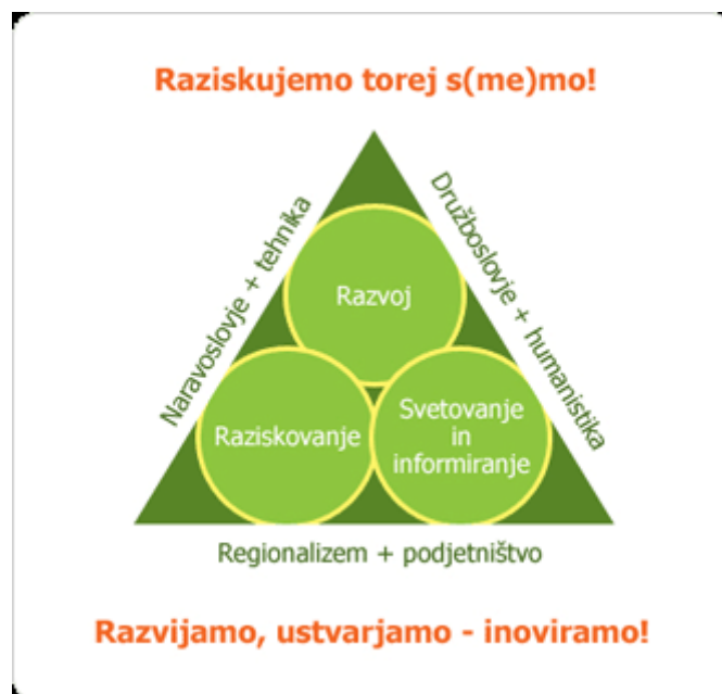
Slika 2: Logotip ZRS Bistra