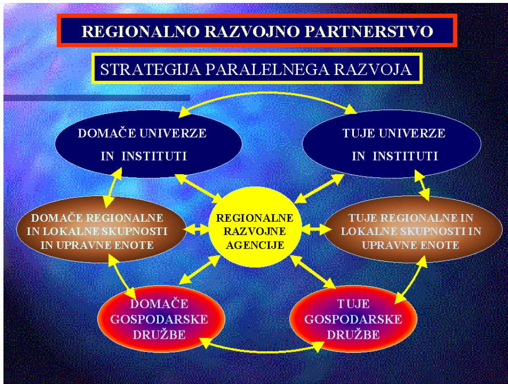
Slika 3: Razvojno partnerstvo

povezovanje med znanostjo, razvojnimi institucijami, resornimi ministristvi, regionalnimi in lokalnimi skupnostmi in gospodarskimi sistemi.