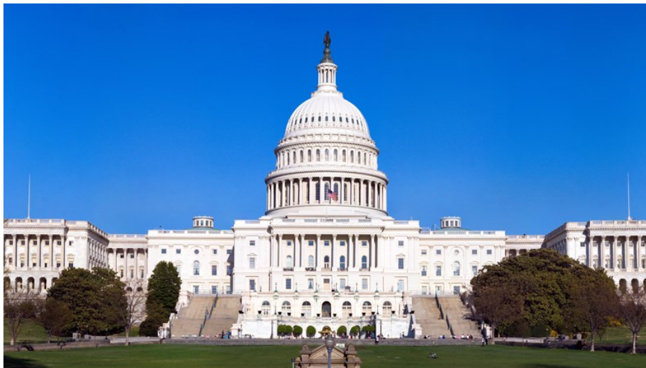
Slika 2: Sedež ameriškega kongresa

V nadaljevanju si bomo ogledali značilnosti obeh domov, kakšne naloge ima kongres in volilni proces. Podrobneje bomo raziskali zakonodajni proces in ugotovili, koliko je kongres odvisen oziroma neodvisen pri sprejemanju zakonodaje od izvršilne veje oblasti. Prav tako bomo proučili postopek ustavne pritožbe (impeachment).