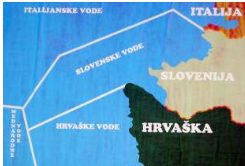
Slika 2: Zemljevid SDS, ki prikazuje sedanje stanje