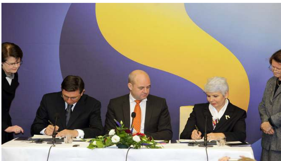
Slika 1: Podpis arbitražnega sporazuma

Arbitražni sodišče bo odločilo o poteku meje med Republiko Slovenijo in Republiko Hrvaško na kopnem in na morju, o stiku Slovenije z odprtim morjem in režimu za uporabo ustreznih obmorskih območij (24ur, 2009).