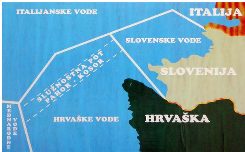
Slika 3: Stanje po referendumu, če bo sporazum potrjen