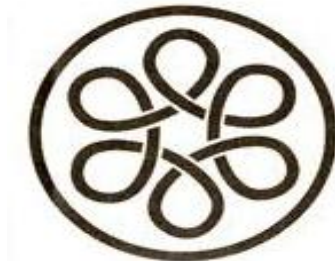
Slika 1: Zaščitni znak ZRSVN

Najpopolnejše varstvo narave zajema znak dejavnosti varstva narave, kjer je prepleteno šest zank, ki predstavljajo soodvisnost vode, zemlje, zraka, živali, rastlin in človeka.