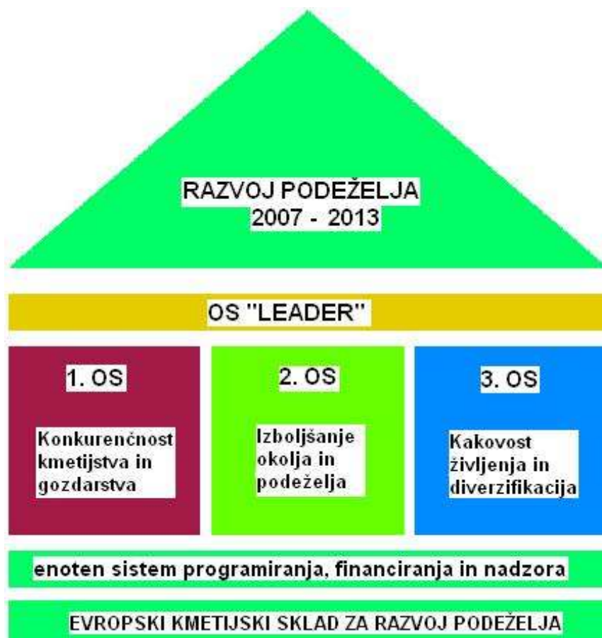
Slika 1: Razvoj podeželja 2007 – 2013

Vir: Program razvoja podeželja Republike Slovenije za obdobje 2007 – 2013 (2007, str. 6).