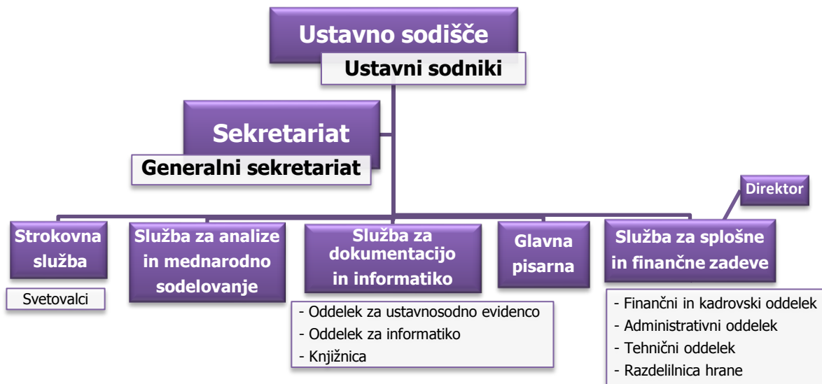
Slika 5: Organizacija služb Ustavnega sodišča