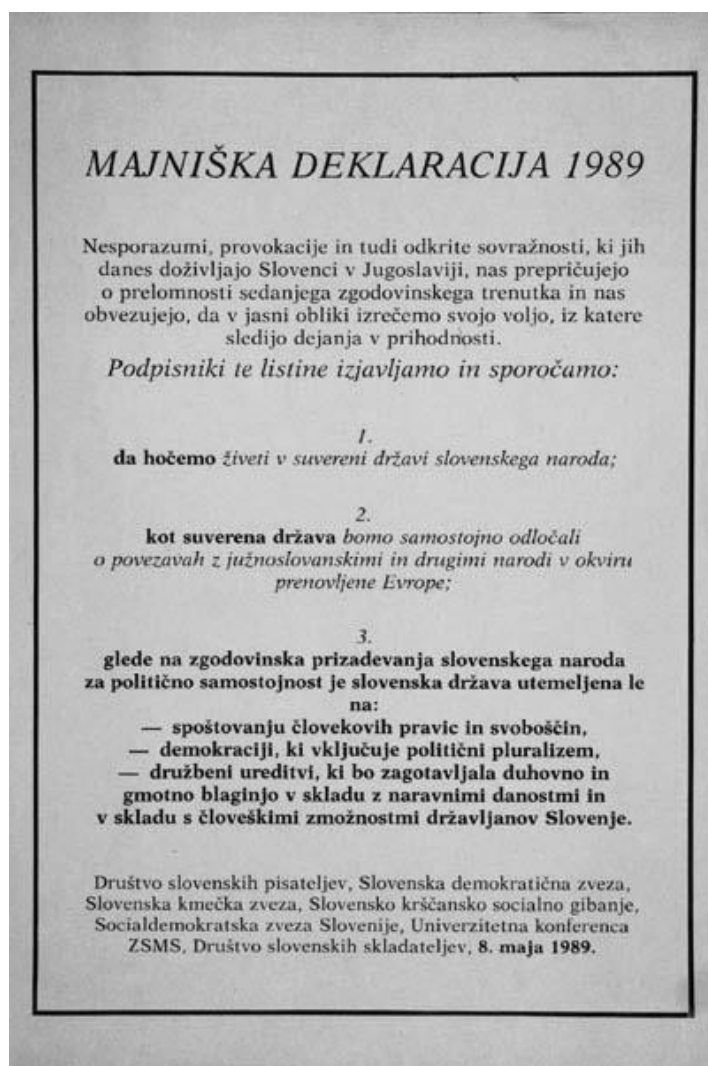
Slika 2: Majniška deklaracija

Kot navaja Rupnik (Rupnik, Cijan & Grafenauer, 1996, str. 19), je v letih 1988 in 1989 prišlo do močnega nacionalnega gibanja z jasnim ciljem – samostojen položaj Republike Slovenije. Odras tega gibanja je bila Majniška deklaracija leta 1989, s katero so slovenske opozicijske politične stranke zahtevale samostojno državo za slovenski narod. Zahteve, izražene v Majniški deklaraciji, so postale temeljni program nastajajočih strank demokratične opozicije. Do prvih resnih sporov z državo je prišlo ob sprejemanju sprememb zvezne Ustave leta 1987 in 1988, kjer je bila vse bolj očitna velika želja po večji centralizaciji države. Vse bolj pa so se v Sloveniji začele pojavljati možne želje po osamosvojitvi.