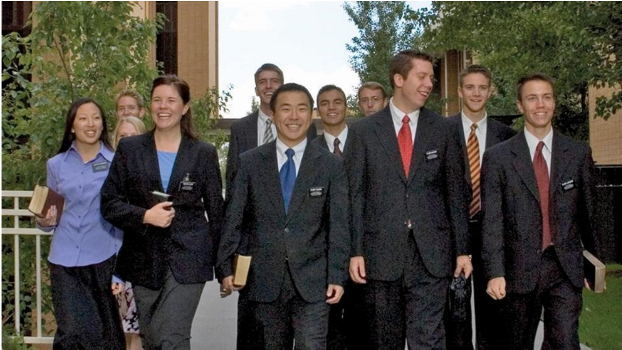
Mormonski misijonarji 12