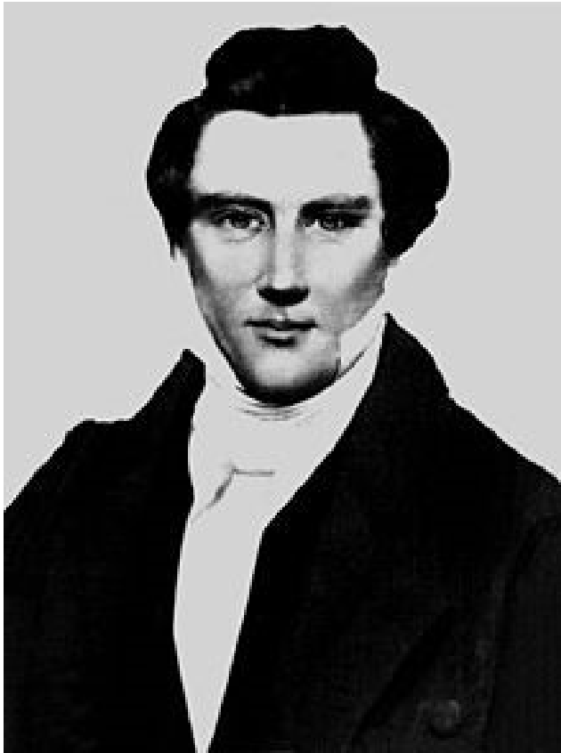
Fotografija Josepha Smitha iz leta 1843 4

Joseph Smith mlajši, rojen 23. decembra 1805 v mestu Sharon v Vermontu v Združenih državah Amerike, je začetnik in prvi vodja mormonskega gibanja. V času od njegovega življenja do smrti leta 1844 je imela novonastala cerkev 26.146 članov. 19. stoletje v New Engu, mestu v Združenih državah Amerike, je bilo obdobje, ko so bili tamkajšnji prebivlaci folklorno vraževerni. Verjeli so v magijo, vizije, sekundarne oči, magične kamne in skrite zaklade. Ljudje so plačevali »strokovnjakom«, da jim pomagajo najti zaklade, ki naj bi bili zakopani v okrožnih hribih. V obdobju med 1820 do 1827 so bili Joseph Smith, njegov brat Hyrum in njegov oče eni od teh tako imenovanih »strokovnjakov«. Joseph Smithovi prvi problemi z oblastjo so se zgodili leta 1826, ko je bil aretiran v Bainbridgeu (New York), ko ga je nekdo, ki ga je najel, obtožil, da je prevarant.