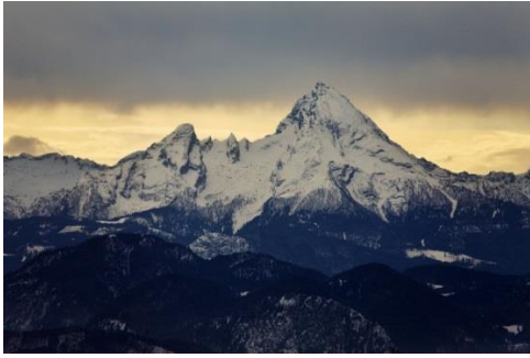
Slika 5: Watzmann