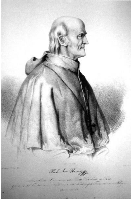
Slika 2: Litografija Valentina Staniča, izdelal Ignaz Fertig po risbi slikarja Wilhelma Gaila leta 1846