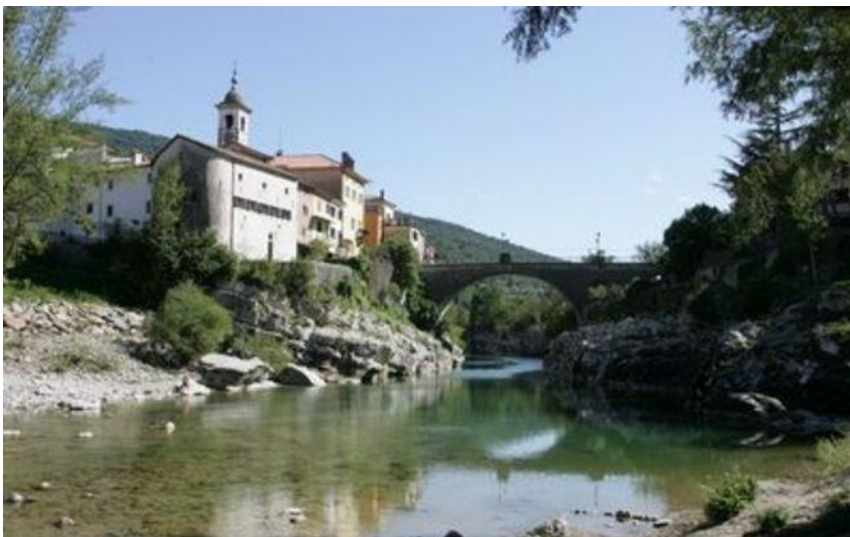
Slika 1: Kanal ob Soči.