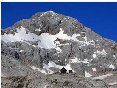
Slika 4: Triglav in Staničeva koča