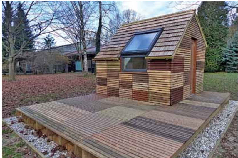
Figure 1: View of the Model house for monitoring of service life of wood. The house is located at the Department of Wood Science and Technology. House summer of 20 was constructed in the 13 and in October 2013 the façade was mounted.

Slika 1: Videz modelnega objekta za spremljanje življenjske dobe lesa. Objekt je na vrtu Oddelka za lesarstvo in je bil postavljen poleti 2013, konec oktobra 2013 smo nanj pritrdili še fasado.