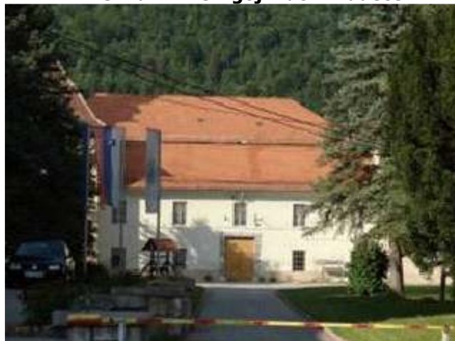
Slika 1: Prevzgojni dom Radeče