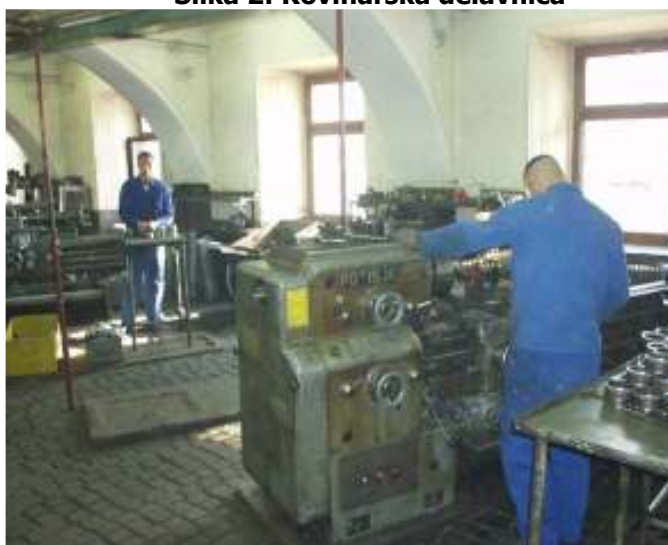
Slika 2: Kovinarska delavnica

Delovno usposabljanje v Prevzgojnim domu Radeče se izvaja v lastnih učnih delavnicah. Redno se izvaja usposabljanje na 6 različnih delovnih področjih (mizarstvo, kovinarstvo, ličarstvo, elektro, gradbeništvo, kuhinja), občasno pa še na treh področjih (parkovno urejanje, šivalnica, pralnica). Usposabljanje traja 6 ur in 45 minut dnevno. Osnova za delovno usposabljanje so zunanja naročila ( fizične osebe, šole, razni zavodi, podjetja,...). Mladoletniki se lahko vključijo tudi na delo v zunanja podjetja. Za dobro opravljeno delo dobijo mladoletniki tudi denarno nagrado, ki znaša od 50 do 100 EUR.