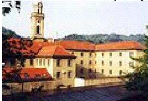
Slika 5: Mladoletniški zapor Celje