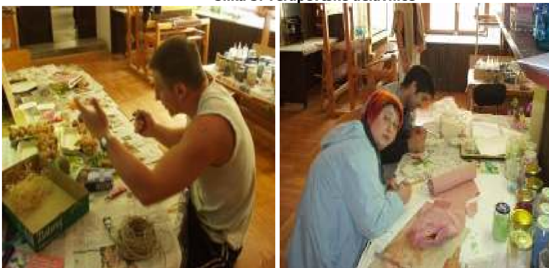
Slika 3: Terapevtske delavnice